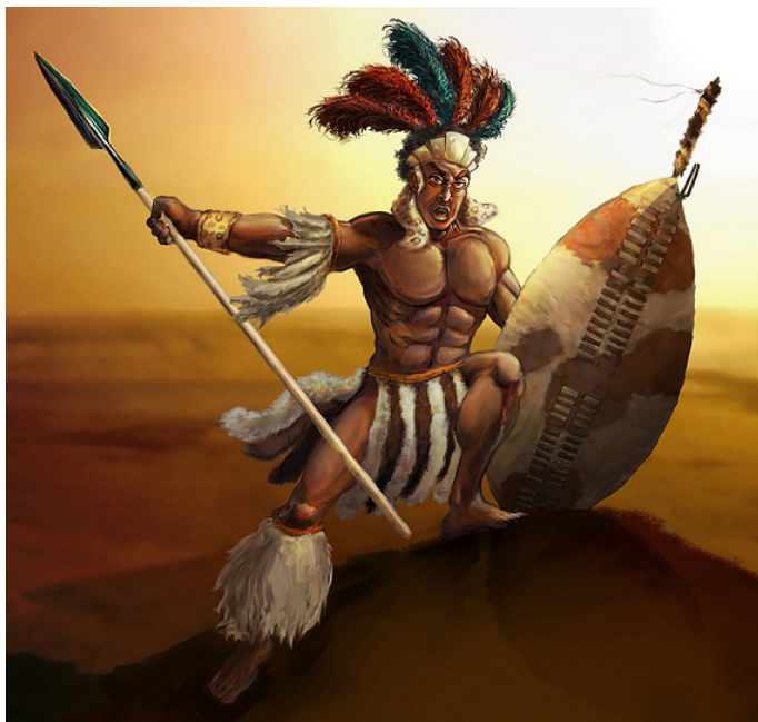
It's fun to stay at the Y.M.C.A.